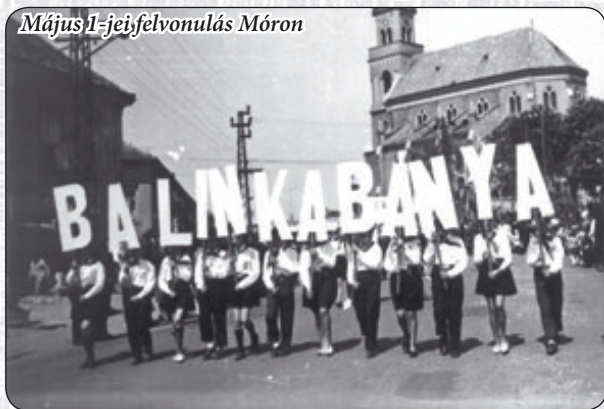
Május 1-jei felvonulás Mórton