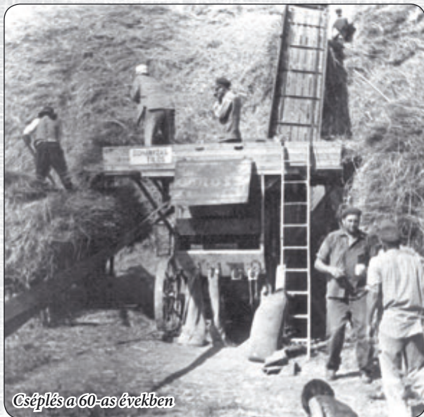
Cséplés a 60-as években