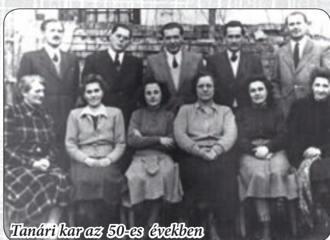
Tanári kar az 50-es években

Az 1730-as években elkészült az első evangélikus iskola, majd 1814-ben indult a településen a római katolikus iskola működése. A II. világháborút követően továbbra is egyházi kezelésben maradtak az iskolák. Állami Elemi Iskola építését az tette szükségessé, hogy Kisgyón-bánya körzetben megnőtt a népesség száma.