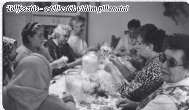
Tollfosztás - a téli esték vidám pillanatai