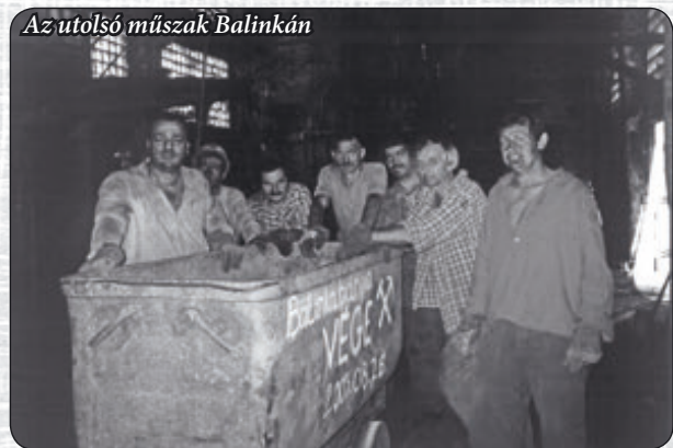
Az utolsó műszak Balinkán