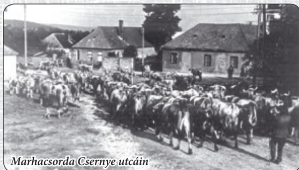
Marhacsorda Csernye utcáin