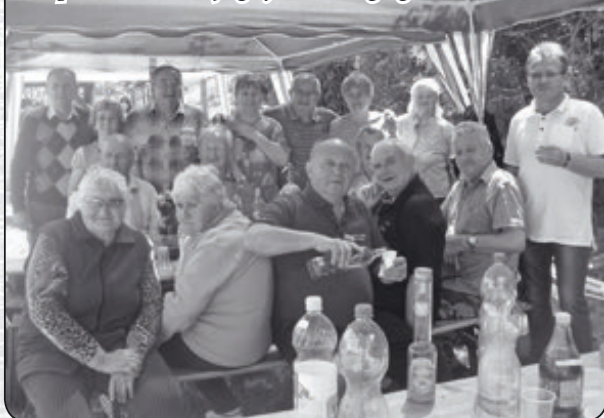
Főzőpartin az I. sz. Nyugdíjas Klub tagsága