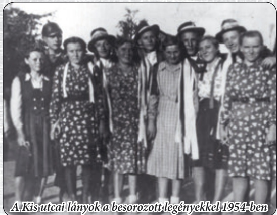
A Kisutcai lányok a besorozott legényekkel 1954-ben