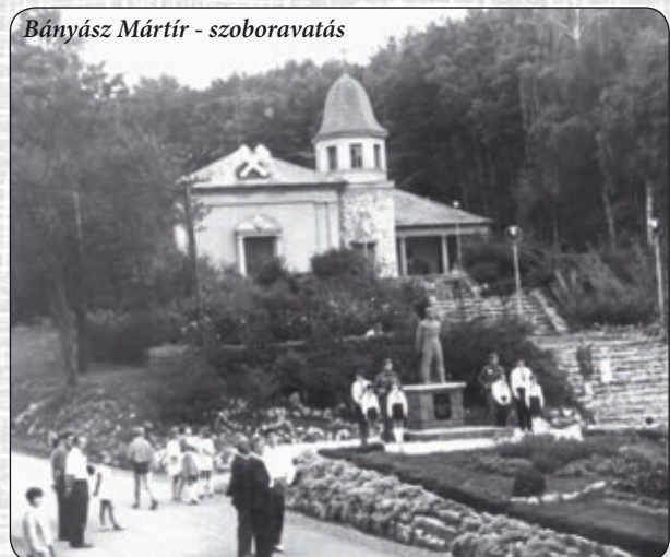
Bányász Mártír - szoboravatás