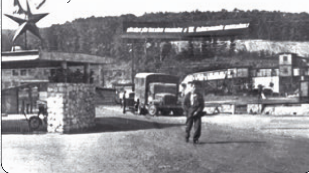
Balinka bánya az 50-es években

1922. szeptember 15-én „Bakony Vidéki Kőszénbánya Rt.” néven részvénytársaság alakult. A bánya 1924-ig termelt, összértéke 6028 tonna volt. A bányabeli szállítást talicskákkal és facsillével, kézzel, a termelvény elszállítását a környező községekbe és a bodajki vasútállomásra a bakonycsernyei fuvarosok lófogattal végezték. A bánya a mai köztemető helyén üzemelt.