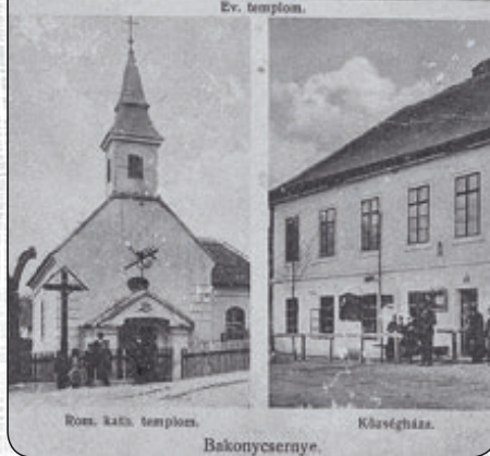
Rom. kat. templom.