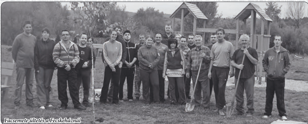
Facsemete ültetés a Fecskeháznál