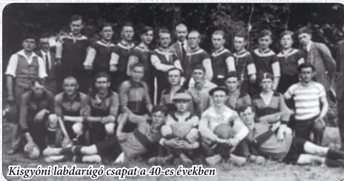
Kisgyóni labdarúgó csapat a 40-es években