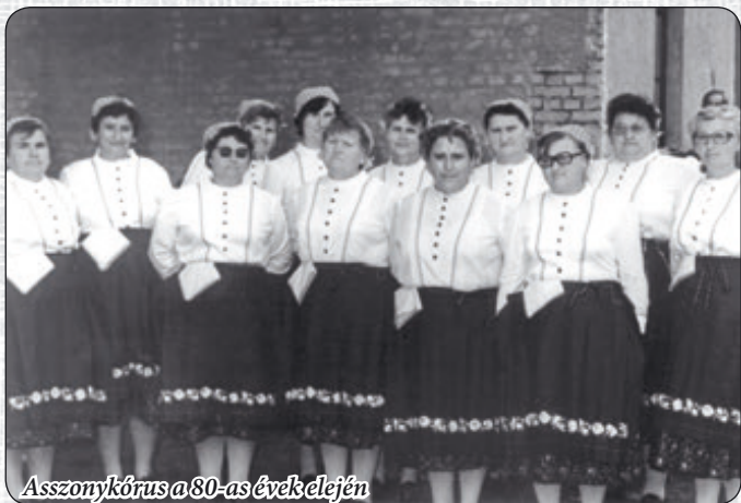
Asszonykórus a 80-as évek elején