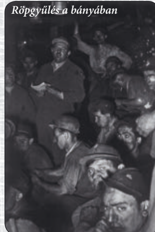
Röpgyűlés a bányában

1951 végén kezdte meg a termelést Balinka akna. 1952-ig a Kisgyóni szén elszállítása Kiszvonnattal történt Bodajkig, a nagyvasúti állomásra. A Bodajk-Balinka-bánya közötti normál vasútvonal elkészülte után már Balinka-bányán történt a Kiszvagonok üritése nagyvagonokba, osztályozás után.