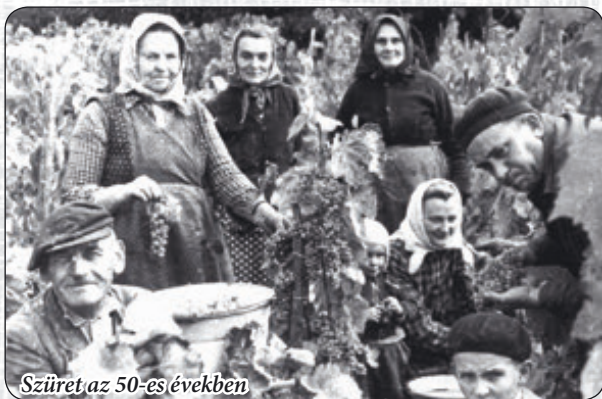
Szüret az 50-es években