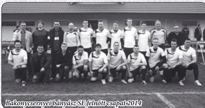
Bakonycsernyei bányász SE felnőtt csapat 2014