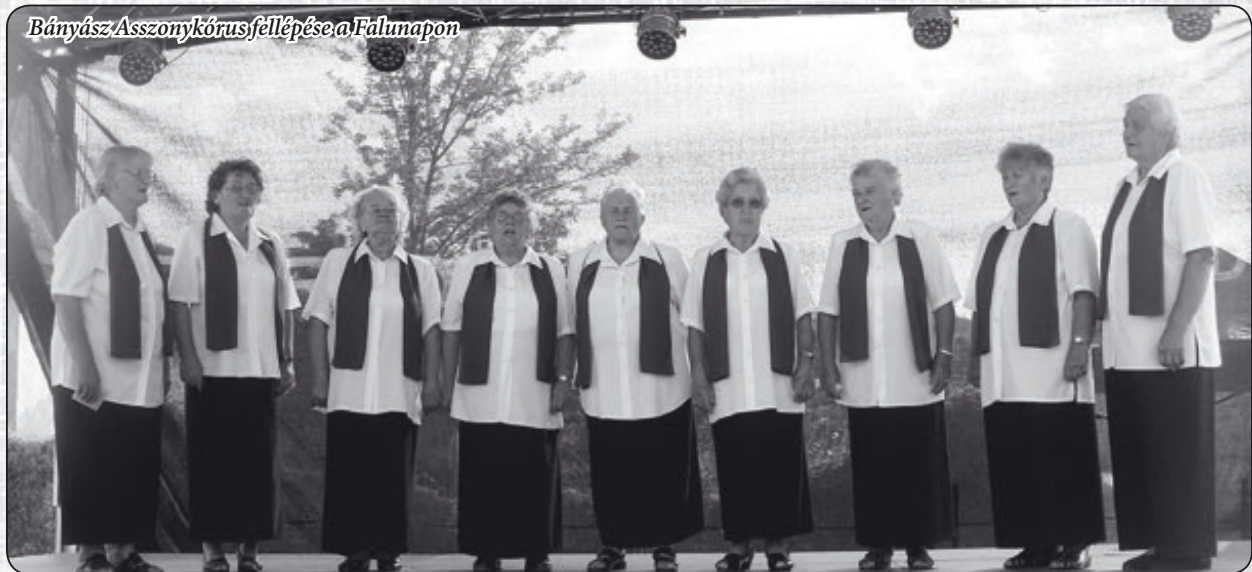
Bányász Asszonykórus fellépése a Falunapon