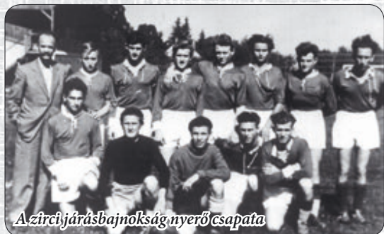
A zirci járásbajnokság nyerő csapata