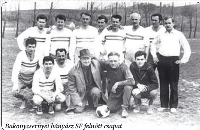
Bakonycsernyei bányász SE felnőtt csapat