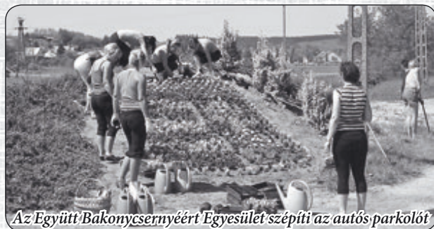
Az Együtt Bakonycsernyéért Egyesület szepíti az autós parkolót