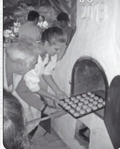
Készül az első kemencés pogácsa

Bakonycsernye község hagyományörző tevékenysége nem merül ki a bányász hagyományok ápolásában. A település közösségi programjainak megvalósításában aktív részt vállalnak oktatási intézményeink, egyházaink, civil szervezeteink, klubjaink tagjai. Kiadványunk záró hasábjain szeretnénk egy kis ízelítőt nyújtani a település fejlődésében meghatározó szerepet játszó civil szervezetekről, közösségekről.