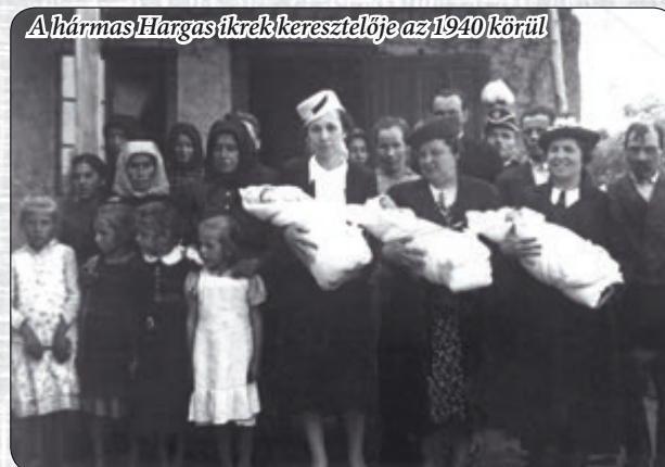
A hármashargasíkok keresztelője az 1940 körül