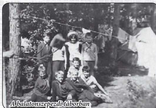
A balatonszepezdi táborban