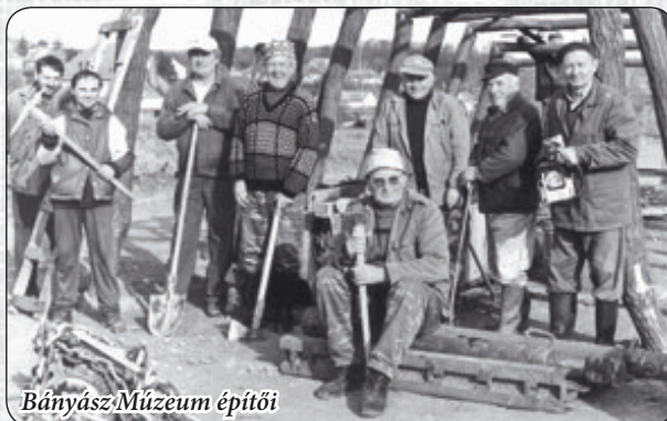
Bányász Múzeum építői