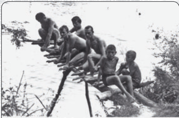
A halastónál 1966-ban