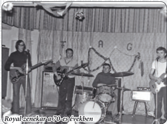
Royalzenekar a 70-es években