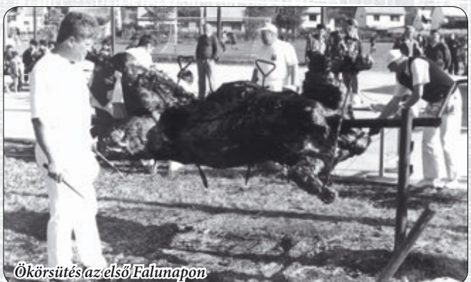
Ökörsvítés az első Falunapon