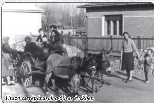
Utazó cseréparusok a 60-as években