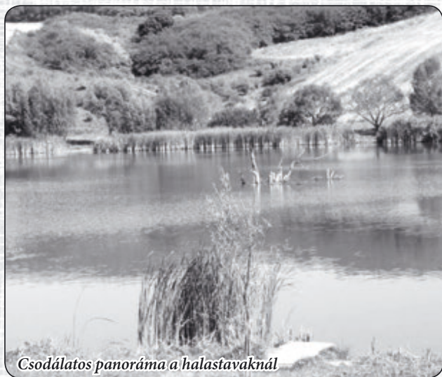
Csodálatos panoráma a halastavaknál

Csernye földesurai a gróf Zichyék, már a XVI-II. század derekán létesítettek halastavat a mai tavak helyén. A csernyei jobbágyokkal hatalmas gátat építettek, így az átfutó Fekete-berki patak vizét megduzzasztva nagy tavat nyertek, melyben főleg pontyot tenyésztettek az évszázad végéig. A II. világháborút követő évtizedben a halgazdálkodás megszűnt. A tavak a csernyei kedvenc fürdőhelyévé vált.